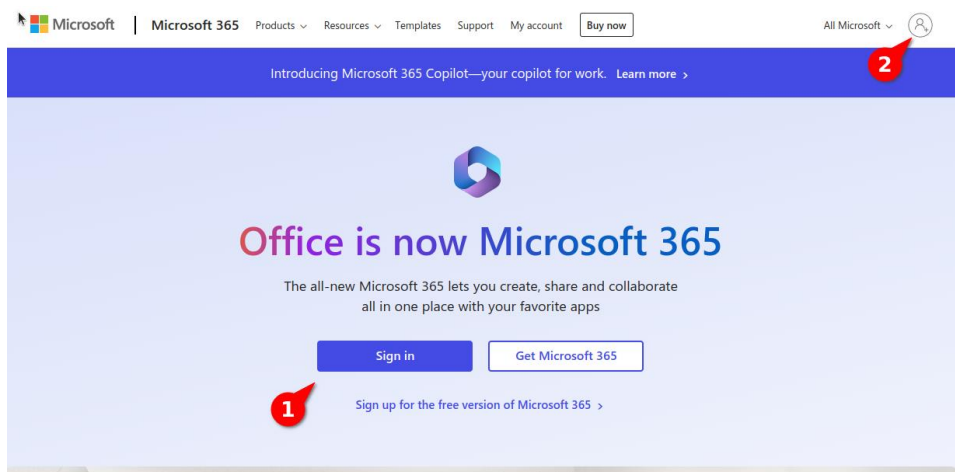
Слика 1: Приступ сервису Microsoft 365

2. У прозору за приступ, кликом на дугме „Sign in“ (опција 1) или на слику корисника (опција 2) потврдите да желите да се пријавите уносом корисничког имена и лозинке.